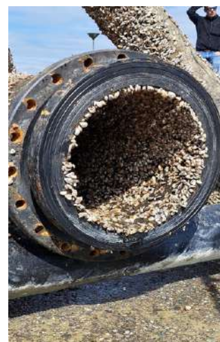
À gauche: vue sur une crépine lors de l'inspection en juillet 2022- une petite partie de la surface extérieure a été nettoyée par le plongeur pour mieux montrer l'épaisseur de la couche de colonisation.