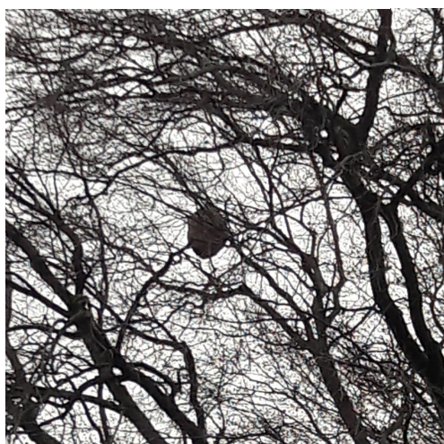
Figure 5: nid visible une fois les feuilles de arbres tombées, Genève, novembre 2023

Ces nids ne se voient pas et ne se trouvent pas facilement. Ils contiennent des milliers d'individus et peuvent générer des centaines de reines pour l'année suivante. Ils sont en forme de poire avec les bords nets (ne pas confondre avec les boules de gui ou les nids de corvidés).